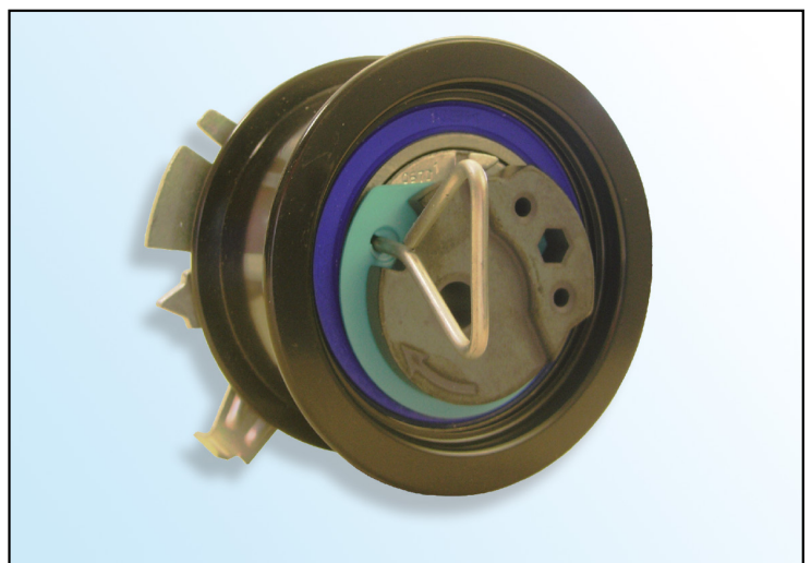
Figur 1: 531 0565 30 (gammel versjon)

Som en del av den kontinuerlige utviklingen av våre produkter, har spennrullen 531 0565 30 blitt modifisert.