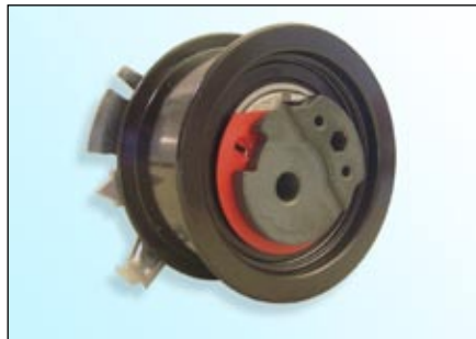
Fot. 1: 531 0628 30 (stara wersja)