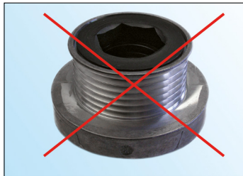
Figur 1: 535 0117 10