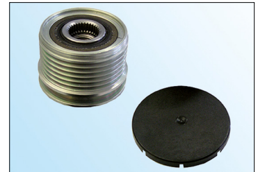
Figur 2: 535 0105 10

Generatorremskiven 535 0117 10 (Fig. 1) er ikke lenger tilgjengelig og har blitt skiftet ut med friløpremskiven OAP 535 0105 10 (Fig. 2).