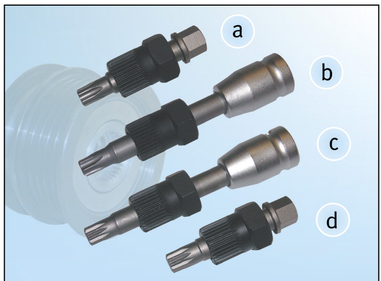
Figur 2: Oversikt over spesialverktøy