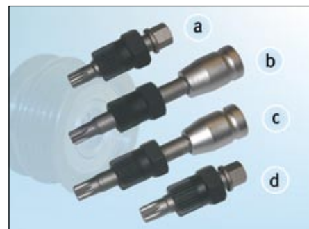
Fot. 2: Przegląd kluczyków do sprzęgiełek alternatora