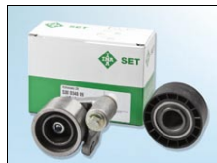
Foto 3: SET 530 0348 09

Oprócz pojedynczego napinacza 531 0377 10, Schaeffler Automotive Aftermarket oferuje również zestawy bez paska SET oraz z paskiem KIT, zawierające niezbędne elementy do wymiany paska zębatego.