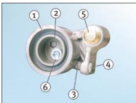
Foto 2: Napinacz 531 0377 10