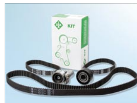
Foto 4: KIT 530 0348 10

Właściwe części zamienne dobrać można w naszym katalogu-online, pod adresem www.Schaeffler-Aftermarket.pl lub portalu RepXpert pod adresem www.RepXpert.com .