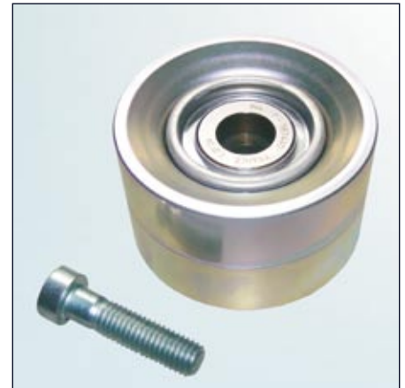
Fot.2: 532 0410 20 - nowa wersja

W wyniku prac mających na celu nieustanne udoskonalanie naszych produktów, stworzono nową wersję rolki prowadzącej 532 0410 20.