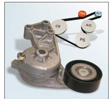
Figur 2: Remstrammeren 534 0132 30 installert i 1.9 TDI motorer med rembane

Hvis den v-ribbede remmen utsettes for sterk, dynamisk bevegelse, kan dette føre til at motoren produserer høye lyder.