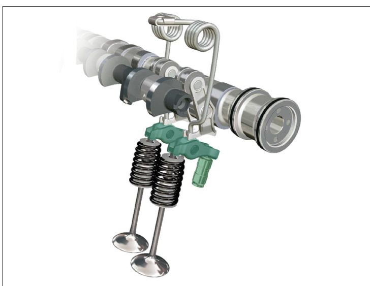
Figur 1: Oversikt over BMW Valvetronic

I BMW Valvetronic og PSA motorer er graderte vipparmer montert på både inntaksventilsiden og eksosventilsiden.