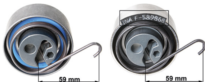
Foto 2: 531 0819 10 – stary wygląd (po lewej), nowy wygląd (po prawej)

Znakami rozpoznawczymi są numery naniesione na rolce oraz różne kolory sprężyn (Foto 1, 2).