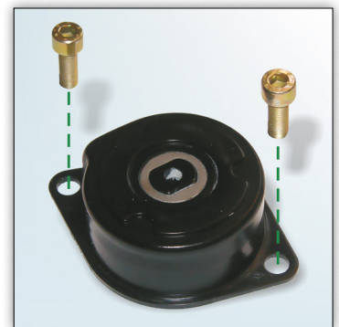
Figur 2: Utforming med to M8x22 bolter