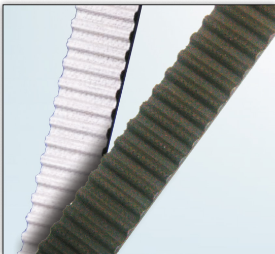
Figur 2: Sort og hvitt belegg på tannprofilen

For eksempel har enkelte registerremmer et belegg med polytetrafluoretylen – vanligvis kjent under merkenavnet Teflon®. Dette belegget reduserer friksjon og slitasje på remmens tannside, og forbedrer dermed brukstiden når det brukes under stor belastning, som i moderne dieselmotorer. Dette Teflon® belegget er vanligvis sort eller hvitt (se bilde 2); selve fargen har ingen effekt på funksjonen.