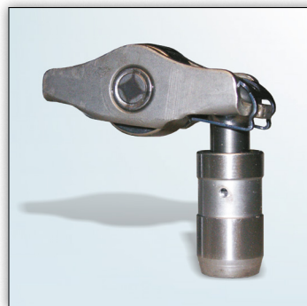
Figur 1: Design 1

(1) 422 0076 10 (erstattet) (1) 422 0102 10 (ny) (2) 420 0221 10 (erstattet) (2) 420 0222 10 (ny)