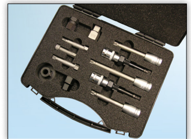
Figur 3: INA spesialverktøy, delnr.: 400 0241 10

De to friløpsremskivene OAP er fullt ut i samsvar med de tekniske kravene og er bare forskjellige i deres utseende.