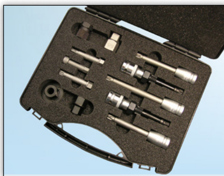
Foto 3: Specjalne narzędzie INA, nr art.: 400 0241 10

Pomimo różnic w wyglądzie, obie wersje wolnego koła pasowego alternatora całkowicie spełniają wymogi techniczne producenta samochodu.