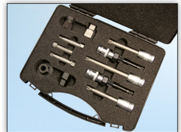
Figur 3: INA spesialverktøy Delnr. 400 0241 10

Den nye friløprensken OAP fra Schaeffler Automotive Aftermarket oppfyller de tekniske kravene på alle punkter, og er bare forskjellige i deres utseende.