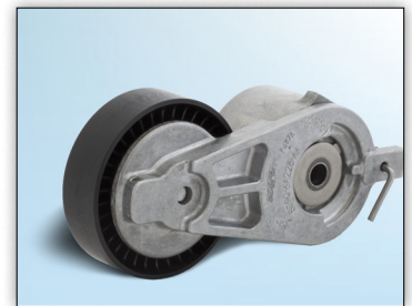
Figur 2: Versjon 2

I de oppførte kjøretøyene, er to ulike versjoner av spennheten for aggregatdriften installert direkte fra fabrikk (ex-works).