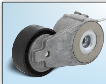
Figur 1: Versjon 1

Modell: Ford: Galaxy, Mondeo IV, S-Max Motor: 1.8 TDCi OE nr.: 6G9Q-6A228-BC / 1425510 8G9Q-6A228-AA / 1567809 Artikkel nr.: 534 0412 10