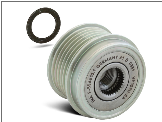
Figur 2: Ved montering av friløpsremskiven OAP på en Bosch generator, må den medfølgende 1,4 mm tykke skiven brukes!