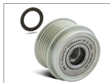
Foto3: Podczas montażu wolnego koła na alternatorze Bosch (Ford Transit) należy zastosować dołączoną podkładkę dystansową o grubości 1.4 mm.

Należy stosować się do zaleceń producenta pojazdu!