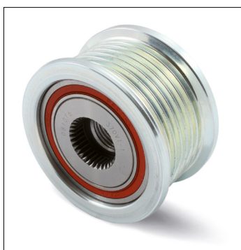
Figur 1: tidligere utforming

Toyota: Hilux, Fortuner Motor: 2.5 D-4D, 3.0 D4-D Artikkel nr.: 535 0128 10 OE nr.: 27415-0L040