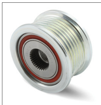
Foto1: Stara konstrukcja

Producent: Toyota Model: Hilux, Fortuner Silnik: 2.5 D-4D, 3.0 D4-D Nr.Ref.: 535 0128 10 Nr.OE: 27415-0L040