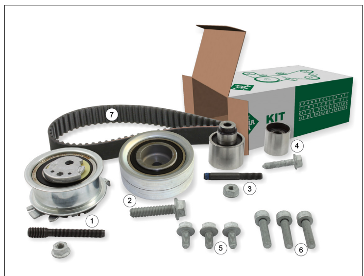
Figur 1: INA spennrullesett 530 0550 10

*Set (Pakke) = registerrem medfølger ikke