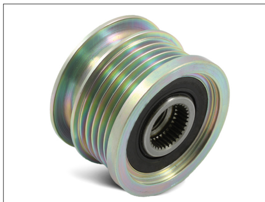
Figur 2: Friløpsremskive OAP 535 0143 10

Som en teknisk løsning tilbyr Schaeffler Automotive Aftermarket en friløpsremskive OAP til disse kjøretøyene. Dette reduserer de dynamiske belastningene i aggregatdriften, og hindrer dermed støyutslipp.