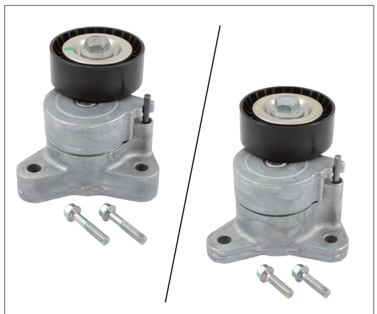
Figur 1: Spennarm 534 0325 10 – Venstre, tidligere versjon med festeskruer. Høyre, ny versjon med festeskruer.

Mitsubishi: 1345A059 (erstattet) 1345A079 (ny)