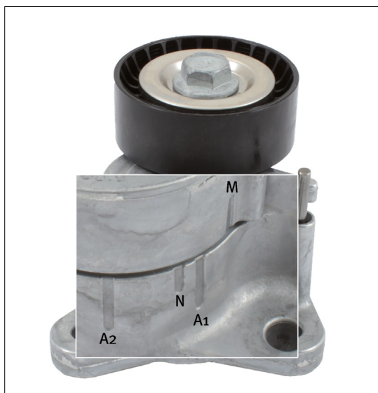
Figur 2: Modifisert merking for spennarmens arbeidsområde.

■ Vennligst merk at de medfølgende festeskruene er kortere for å passe til den tynnere monteringsflensen.