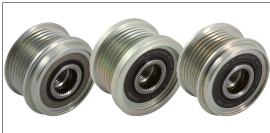
Figur 2: Friløpsremskive OAP 535 0063 10 (venstre), 535 0202 10 (midten), 535 0203 10 (høyre)

Friløpsremskiven OAP kopler ut aggregatdriften fra rotasjonsuregelmessighetene til motoren, og sørger for at den V-ribbede remmen kjører jevnere og stillere. Som et resultat er motoren stillere, og kjøringen mer komfortabel.