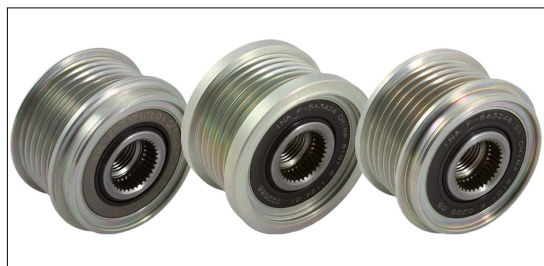
Foto 2: Wolne koło pasowe alternatora 535 0063 10 (po lewo), 535 0202 10 (na środku), 535 0203 10 (po prawo)

W wymienionych powyżej pojazdach ze sztywnym kołem pasowym alternatora mogą występować wibracje i niepożądane odgłosy dochodzące z napędu pomocniczego. Powstają one na skutek nierównomiernych obrotów silnika Diesla, które są większe niż w przypadku silników benzynowych.