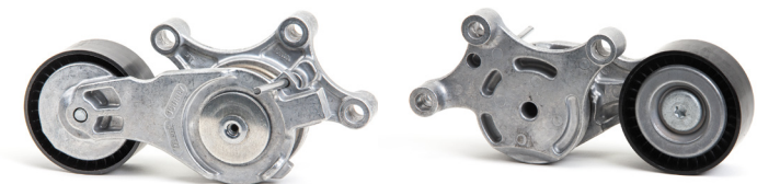
Figure 2: Ny utforming

Som en del av den kontinuerlige utviklingen av våre produkter, har det blitt gjort endringer til spennrullen med delnr. 534 0075 20.