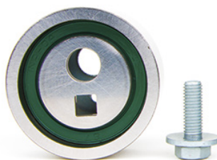
Foto 2: 531 0780 10 - Rolka napinająca INA z dołączoną śrubą