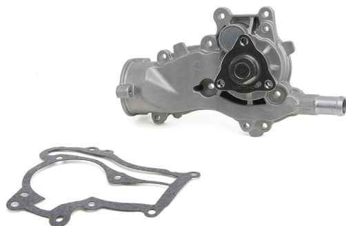
Foto 1: Pompa cieczy 538 0314 10 z uszczelką w zestawie

Dla poprawnego doboru należy używać katalogu online