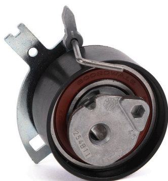
Foto 1: Rolka napinająca INA 531 0810 10

W okresie przejściowym, mogą być dostępne oba typy napinaczy.