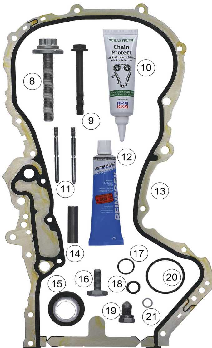
Foto 2: 559 0154 30/559 0154 31 – elementy składowe zestawu INA KIT

Podczas instalacji obudowy rozrządu i miski olejowej należy użyć pinów ustalających znajdujących się w zestawie INA KIT. Dokręcić do głowicy i bloku silnika zgodnie z procedurą montażu producenta.