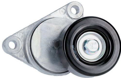
Option B | Variante B | Version B | Variante B | Variante B | Wariant B