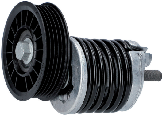
Option B | Variante B | Version B | Variante B | Variante B | Wariant B