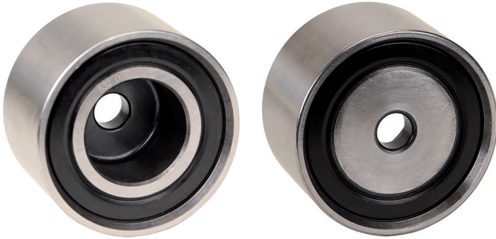
Option A | Variante A | Version A | Variante A | Variante A | Wariant A

Deflection pulley | Umlenkrolle | Galet enrouleur | Polea de inversión | Puleggia di rinvio | Rolka prowadząca