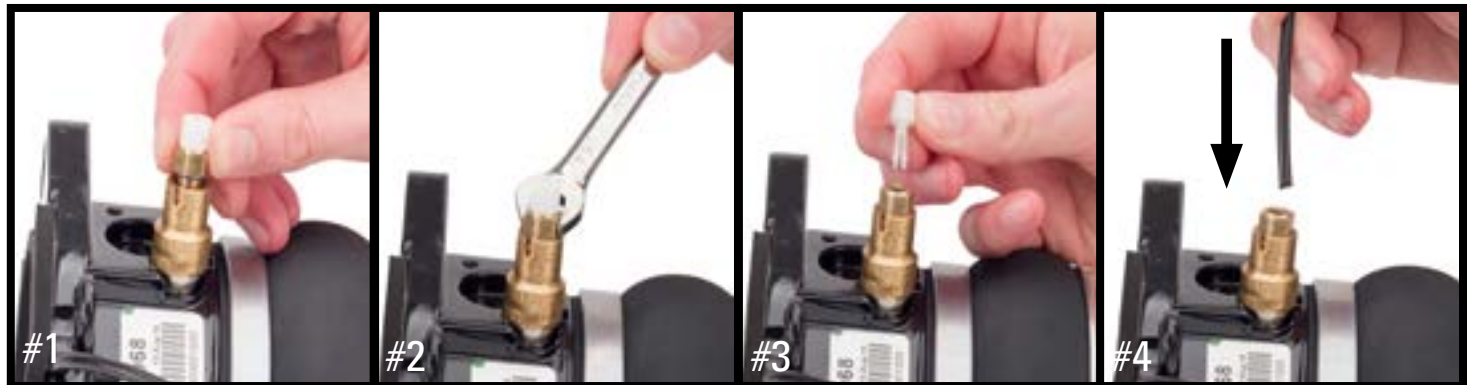
#1 将随产品提供的空气管路接头装入阀门