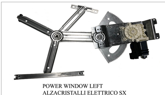
POWER WINDOW LEFT ALZACRISTALLI ELETTRICO SX

LA PRESENTE ISTRUZIONE VALE SIA PER IL LATO SINISTRO CHE PER IL LATO DESTRO.