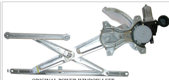
ORIGINAL POWER WINDOW LEFT ALZACRISTALLO ELETTRICO ORIGINALE SX