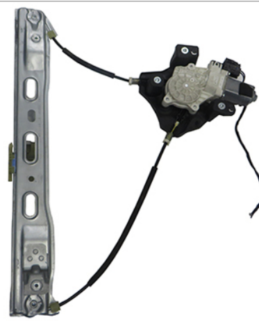
ORIGINAL POWER WINDOW RIGHT ALZACRISTALLI ELETTRICXO ORIGINALE DX