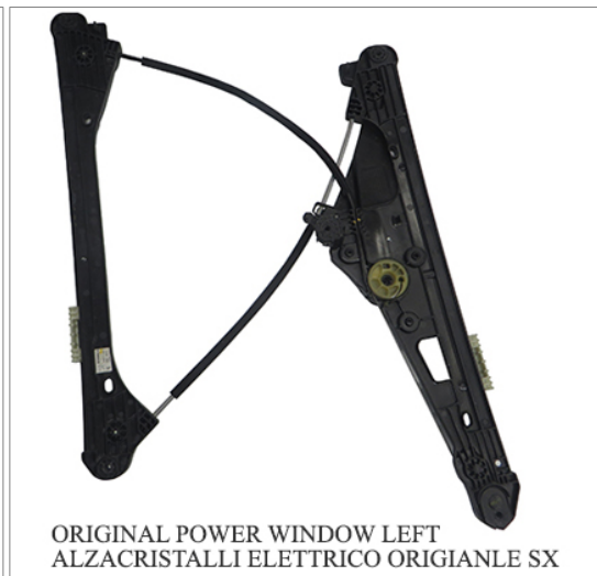
ORIGINAL POWER WINDOW LEFT ALZACRISTALLI ELETTRICO ORIGIANLE SX