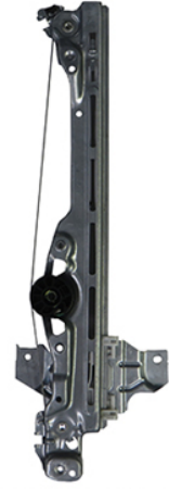
ORIGINAL POWER WINDOW RIGHT ALZACRISTALLI ELETTRICO ORIGINIALE DX