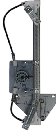
POWER IWNDOW RIGHT ALZACRISTALLI ELETTRICO DX

THIS INSTALLATION INSTRUCTION IS FOR BOTH LEFT AND RIGHT SIDE. CETTE INSTRUCTION DE MONTAGE EST POUR LES DEUX COTES DROIT ET GAUCHE. DIESE MONTAGE-ANLEITUNG IST FÜR DIE BEIDE LINKE UND RECHTE SEITE. ESTA INSTRUCCION DE MONTAJE ES PARA LOS DOS LADOS IZQUIERDO Y DERECHO. ESTAS INSTRUÇÕES VALEM TANTO PARA O LADO ESQUERDO QUANTO PARA O DIREITO. LA PRESENTE ISTRUZIONE VALE SIA PER IL LATO SINISTRO CHE PER IL LATO DESTRO.