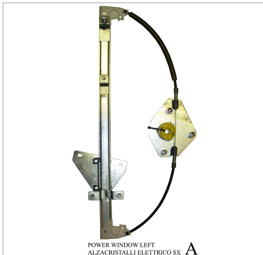
POWER WINDOW LEFT ALZACRISTALLI ELETTRICO SX A

THIS INSTALLATION INSTRUCTION IS FOR BOTH LEFT AND RIGHT SIDE. CETTE INSTRUCTION DE MONTAGE EST POUR LES DEUX COTES DROIT ET GAUCHE. DIESE MONTAGE-ANLEITUNG IST FÜR DIE BEIDE LINKE UND RECHTE SEITE. ESTA INSTRUCCION DE MONTAJE ES PARA LOS DOS LADOS IZQUIERDO Y DERECHO. ESTAS INSTRUÇÕES VALEM TANTO PARA O LADO ESQUERDO QUANTO PARA O DIREITO. DEZE AANWIJZINGEN GELDEN VOOR ZOWEL DE LINKER- ALS DE RECHTERKANT. Η ΠΑΡΟΥΣΑ ΟΔΗΓΙΑ ΑΦΟΡΑ ΤΟΣΟ ΤΗΝ ΑΡΙΣΤΕΡΗ ΟΣΟ ΚΑΙ ΤΗ ΔΕΞΙΑ ΠΛΕΥΡΑ. LA PRESENTE ISTRUZIONE VALE SIA PER IL LATO SINISTRO CHE PER IL LATO DESTRO.