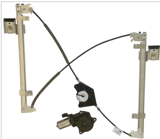
A POWER WINDOW LEFT ALZACRISTALLI ELETTRICO SX

THIS INSTALLATION INSTRUCTION IS FOR BOTH LEFT AND RIGHT SIDE. CETTE INSTRUCTION DE MONTAGE EST POUR LES DEUX COTES DROIT ET GAUCHE. DIESE MONTAGE-ANLEITUNG IST FÜR DIE BEIDE LINKE UND RECHTE SEITE. ESTA INSTRUCCION DE MONTAJE ES PARA LOS DOS LADOS IZQUIERDO Y DERECHO. ESTAS INSTRUÇÕES VALEM TANTO PARA O LADO ESQUERDO QUANTO PARA O DIREITO. DEZE AANWIJZINGEN GELDEN VOOR ZOWEL DE LINKER- ALS DE RECHTERKANT. Η ΠΑΡΟΥΣΑ ΟΔΗΓΙΑ ΑΦΟΡΑ ΤΟΣΟ ΤΗΝ ΑΡΙΣΤΕΡΗ ΟΣΟ ΚΑΙ ΤΗ ΔΕΞΙΑ ΠΛΕΥΡΑ. LA PRESENTE ISTRUZIONE VALE SIA PER IL LATO SINISTRO CHE PER IL LATO DESTRO.