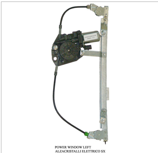
POWER WINDOW LEFT ALZACRISTALLI ELETRICO SX

THIS INSTALLATION INSTRUCTION IS FOR BOTH LEFT AND RIGHT SIDE. CETTE INSTRUCTION DE MONTAGE EST POUR LES DEUX COTES DROIT ET GAUCHE. DIESE MONTAGE-ANLEITUNG IST FÜR DIE BEIDE LINKE UND RECHTE SEITE. ESTA INSTRUCCION DE MONTAJE ES PARA LOS DOS LADOS IZQUIERDO Y DERECHO. ESTAS INSTRUÇÕES VALEM TANTO PARA O LADO ESQUERDO QUANTO PARA O DIREITO. DEZE AANWIJZINGEN GELDEN VOOR ZOWEL DE LINKER- ALS DE RECHTERKANT. Η ΠΑΡΟΥΣΑ ΟΔΗΓΙΑ ΑΦΟΡΑ ΤΟΣΟ ΤΗΝ ΑΡΙΣΤΕΡΗ ΟΣΟ ΚΑΙ ΤΗ ΔΕΞΙΑ ΠΛΕΥΡΑ. LA PRESENTE ISTRUZIONE VALE SIA PER IL LATO SINISTRO CHE PER IL LATO DESTRO.