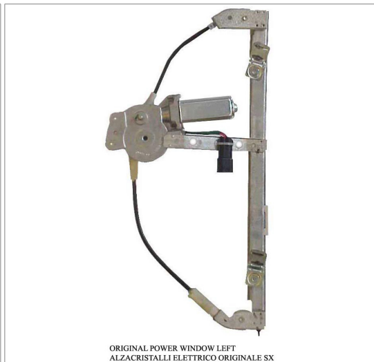
ORIGINAL POWER WINDOW LEFT ALZACRISTALLI ELETRICO ORIGINALE SX