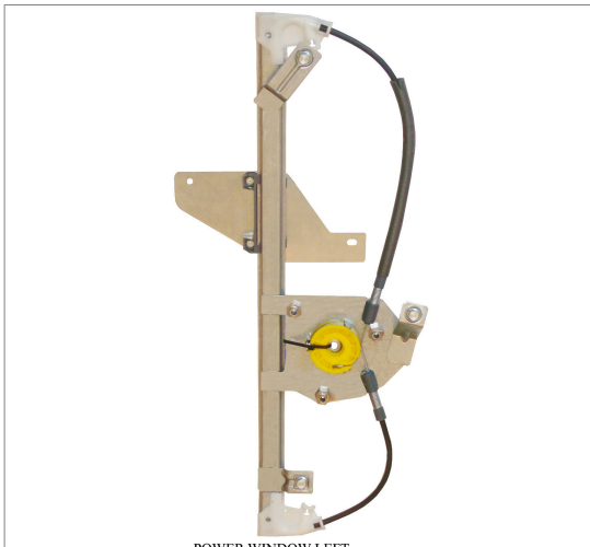
POWER WINDOW LEFT ALZACRISTALLI ELETRICO SX

THIS INSTALLATION INSTRUCTION IS FOR BOTH LEFT AND RIGHT SIDE. CETTE INSTRUCTION DE MONTAGE EST POUR LES DEUX COTES DROIT ET GAUCHE. DIESE MONTAGE-ANLEITUNG IST FÜR DIE BEIDE LINKE UND RECHTE SEITE. ESTA INSTRUCCION DE MONTAJE ES PARA LOS DOS LADOS IZQUIERDO Y DERECHO. ESTAS INSTRUÇÕES VALEM TANTO PARA O LADO ESQUERDO QUANTO PARA O DIREITO. LA PRESENTE ISTRUZIONE VALE SIA PER IL LATO SINISTRO CHE PER IL LATO DESTRO.