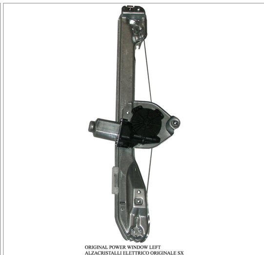
ORIGINAL POWER WINDOW LEFT ALZACRISTALLI ELETTRICO ORIGINALE SX