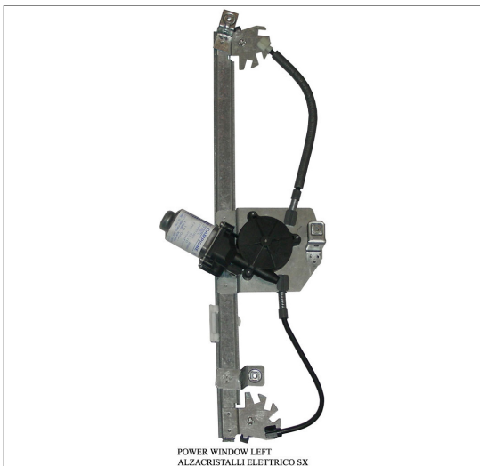
POWER WINDOW LEFT ALZACRISTALLI ELETTRICO SX

THIS INSTALLATION INSTRUCTION IS FOR BOTH LEFT AND RIGHT SIDE. CETTE INSTRUCTION DE MONTAGE EST POUR LES DEUX COTES DROIT ET GAUCHE. DIESE MONTAGE-ANLEITUNG IST FÜR DIE BEIDE LINKE UND RECHTE SEITE. ESTA INSTRUCCION DE MONTAJE ES PARA LOS DOS LADOS IZQUIERDO Y DERECHO. AS PRESENTES INSTRUÇÕES VALEM TANTO PARA O LADO ESQUERDO QUANTO PARA O DIREITO. LA PRESENTE ISTRUZIONE VALE SIA PER IL LATO SINISTRO CHE PER IL LATO DESTRO.