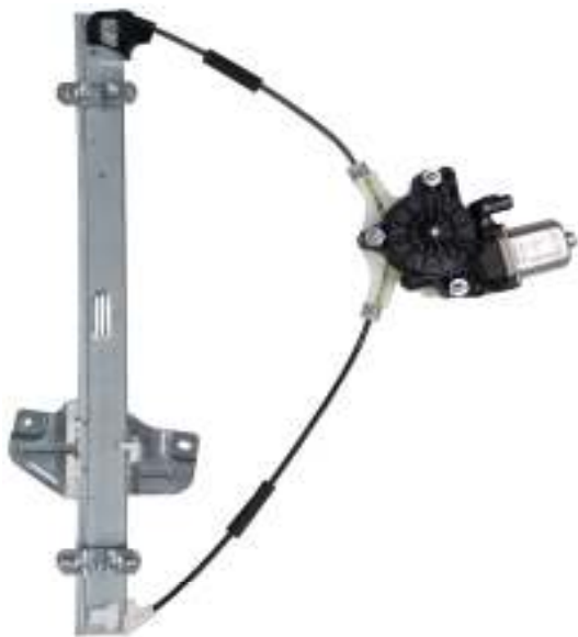
Alzacristallo originale SX