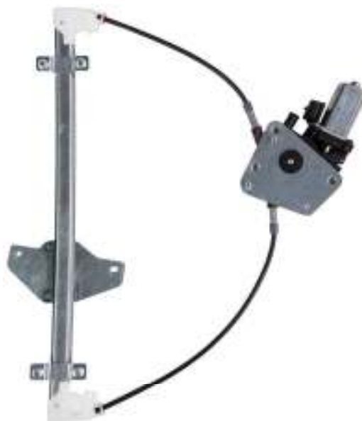
Ns alzacristallo SX