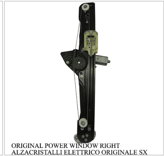
ORIGINAL POWER WINDOW RIGHT ALZACRISTALLI ELETTRICO ORIGINALE SX